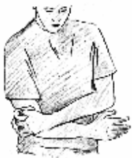
Fig. 1 Lavar e secar cuidadosamente a zona afetada